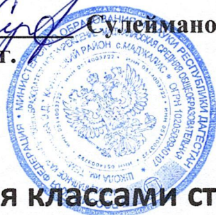
График посещения классами столовой(1-4 классы)